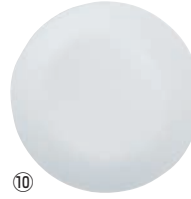
⑩ 大皿 J110-N CP-8910 洗 ワ