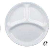
⑫ ランチ皿 (大) J310-N CP-8914 洗 ワ