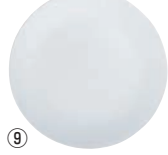
⑨ 中皿 J108-N CP-8909 洗 ワ