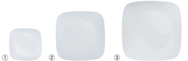
① スクエア小皿 J2206-N CP-8903 洗 ワ ② スクエア中皿 J2211-N CP-8902 洗 ワ ③ スクエア大皿 J2213-N CP-8901 洗 ワ