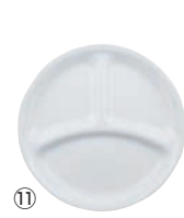
⑪ ランチ皿 (小) J385-N CP-8915 洗 ワ